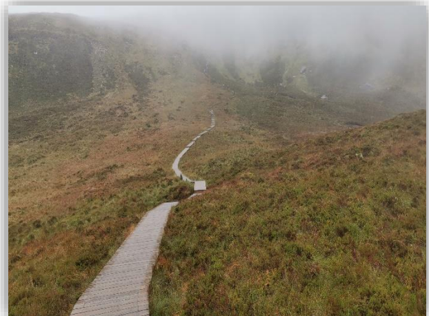
[Abb. 8] „Stairway to Heaven“