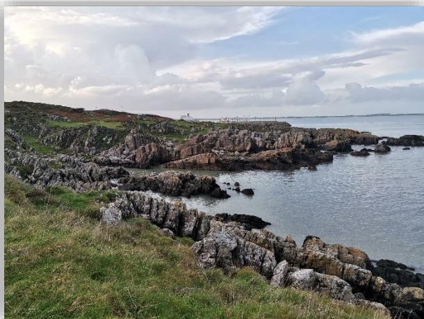
[Abb. 7] Clogherhead Cliff Walk